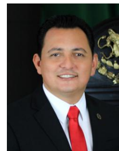
DIP. ANTO ADÁN MARTE TLÁLOC TOVAR GARCÍA Partido Revolucionario Institucional VOCAL